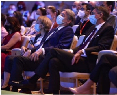
Festival je bil največji kulturni dogodek ob predsedovanju Slovenije Svetu EU-ja. Na posnetku sta minister za kulturo Vasko Simoniti in predsednik republike Borut Pahor.

Festival bi namreč v idealnih pogojih privabil več kot 3000 pevcev iz različnih držav, a je zaradi pandemije potekal v hibridni obliki. Izobraževalno jedro festivala so pripravili na omenjeni televiziji, koncerti v živo pa so potekali na različnih prizoriščih v mestu. Dogajanje so v Cankarjevem domu odprli domači in gostujoči izvajalci s prepletom različnih glasbenih slogov ter novih in že znanih skladb.