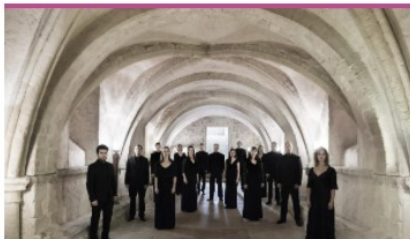
V Ljubljani bo odzvanjal Europa Cantat, največji evropski zborovski festival