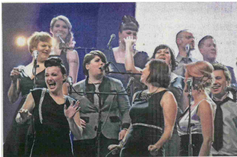
Slovenske barve bo na festivalu Europa Cantat 2021 zastopal tudi Perpetuum Jazzile. Nastopili bodo v torek ob 21. uri na Kongresnem trgu.